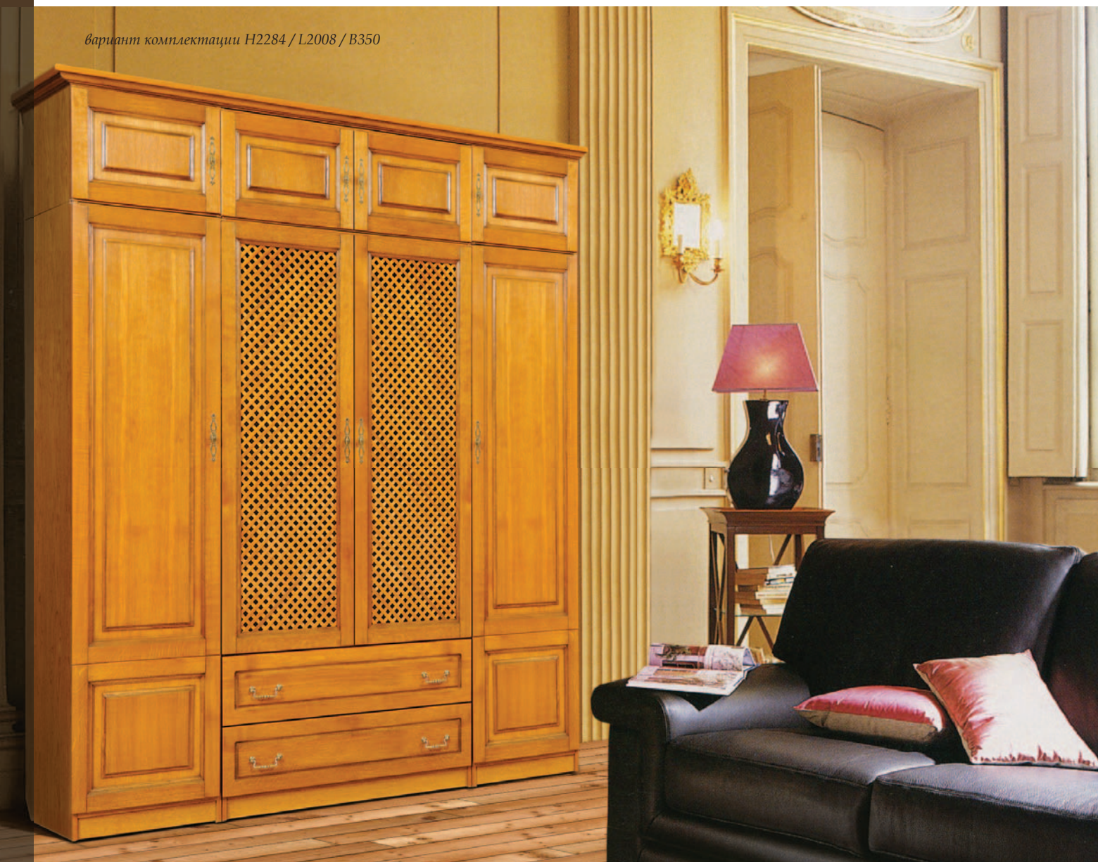
вариант комплектации H2284 / L2008 / B350